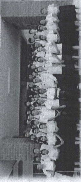
วิทยาลัยอาชีวศึกษาคคนตาบอดขอนแก่น

ที่อยู่ เลขที่ 192 หมู่ที่ 6 ตำบลสำราญ อำเภอเมืองขอนแก่น จังหวัดขอนแก่น 40000 โทรศัพท์ 043-306063-4 มือถือ 094-5283692